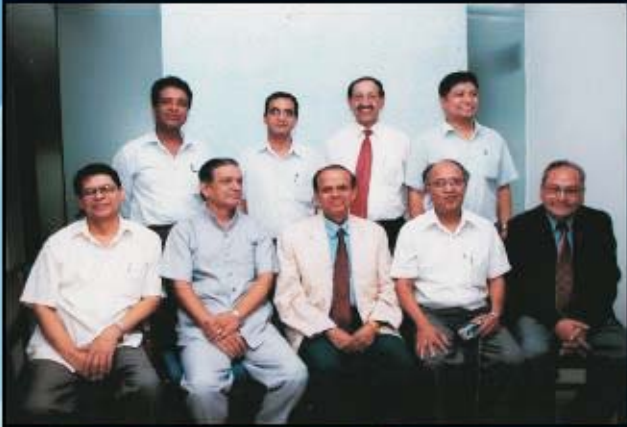
संस्थापक संचालक समितिका साथ प्रमुख कार्यकारी अधिकृत