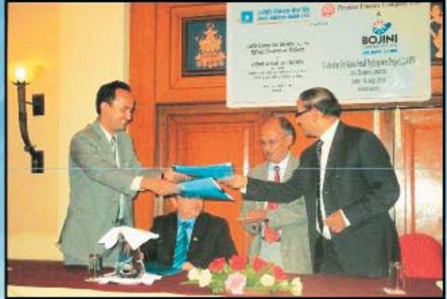
जलाविपुल परियोजनाका लागि सहवित्तियकरण सम्झौता आदान प्रदान