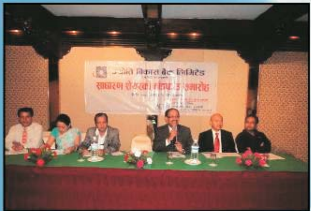
विकास बैंकको साधारण शेर्कर बौडप्रीड सन्मारोह