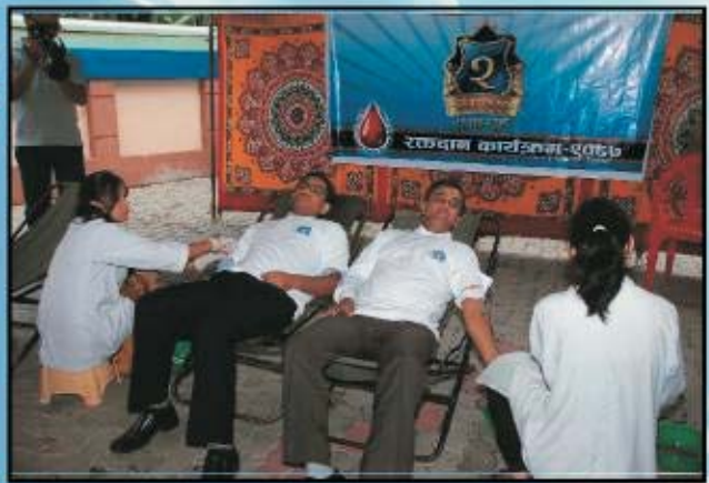
दोस्रो वार्षिकोत्सवका अवसरमा आयोजित रक्तदान कार्यक्रम